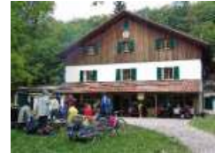
Das Buchberghaus seit 1913