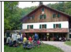
Das Buchberghaus seit 1913